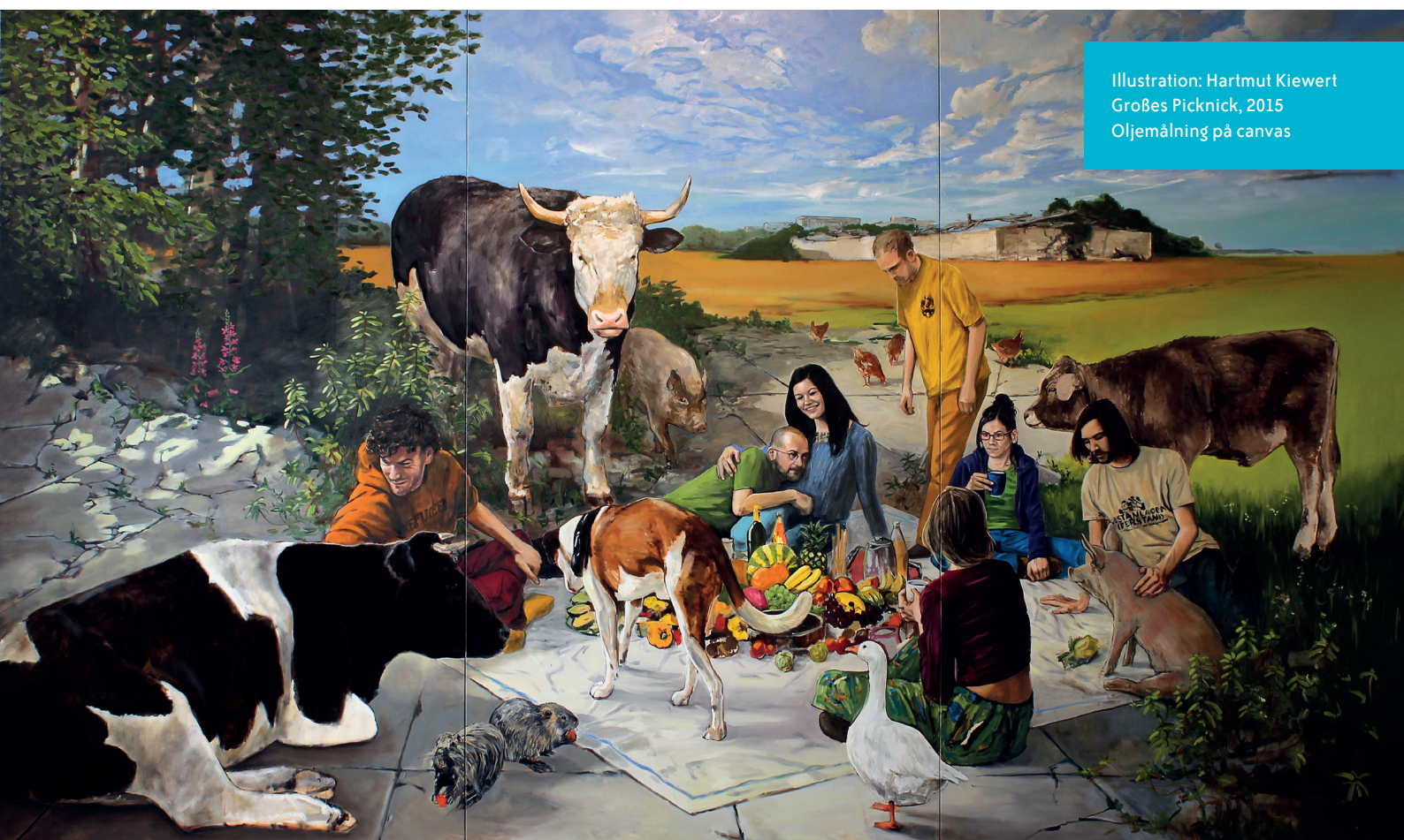
Illustration: Hartmut Kiewert Großes Picknick, 2015 Oljemålning på canvas

Genom stora satsningar på djurfria forskningsmetoder har Sverige tagit klivet och blivit världsledande på innovation som är både säkrare och skonar otaliga djurs liv. Det må låta som en dröm, men det är inte omöjligt. När vi kraftsamlar och arbetar målmedvetet så skapar vi förändring som berör miljontals djur, för en hållbar värld där djur respekteras som kännande individer med rätt till sina egna liv.